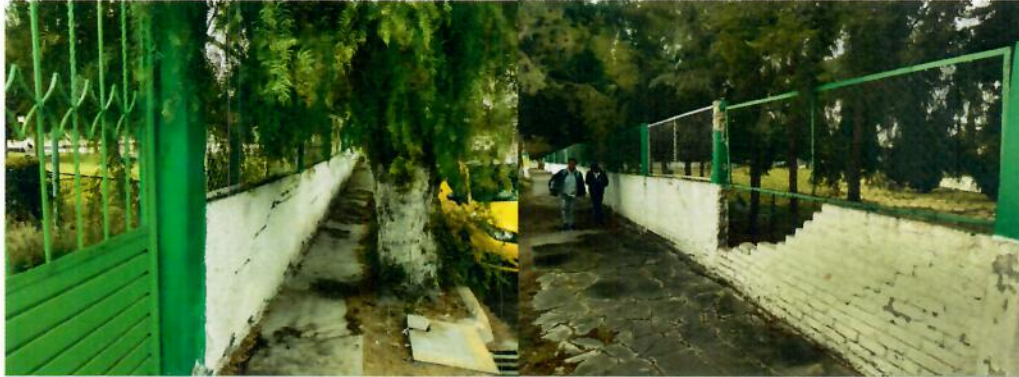
COLADERA Y REGISTRO SIN TAPA

Tecamac CIUDAD SEGURA Y PRÓSPERA AYUNTAMIENTO 2019 - 2021